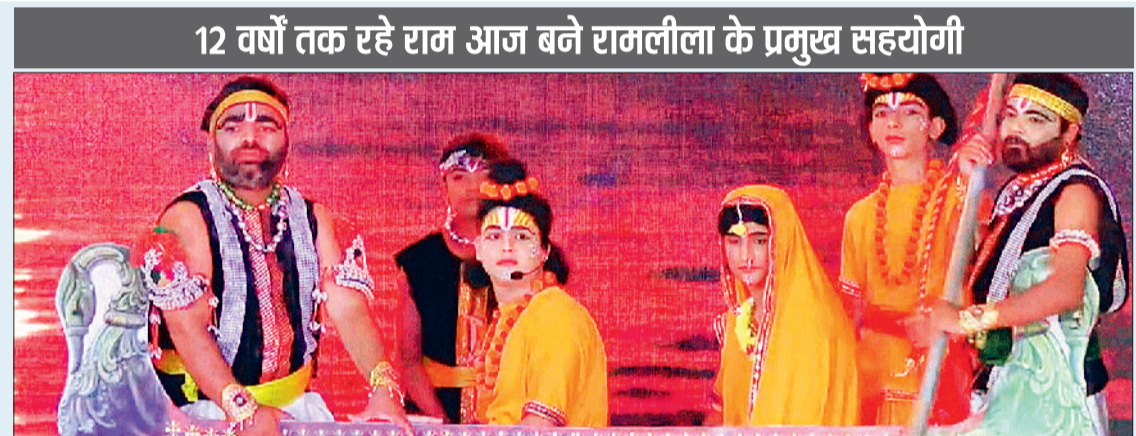
12 वर्षों तक रहे राम आज बने रामलीला के प्रमुख सहयोगी

आदर्श रामलीला नाटक मंडली भाटापारा के 105 वें वर्ष के तृतीय दिवस की भगवान श्रीराम लक्ष्मण सीताजी की आरती में पोहा मिल, दाल मिल, राइस मिल एसोसिएशन, अभिकर्ता संघ, किराना ►► शेष पेज 10 पर